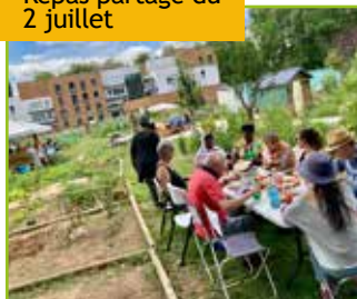
Repas partagé du 2 juillet