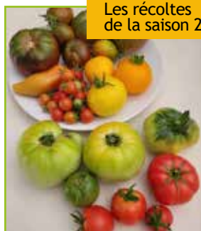
Les récoltes de la saison 2022