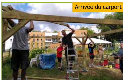
Arrivée du carport