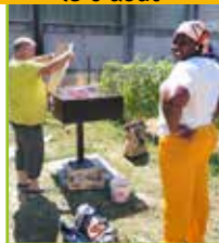
Arrivée du barbecue et repas partagé le 6 août