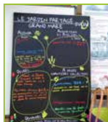
Arrivée d'un panneau d'infos